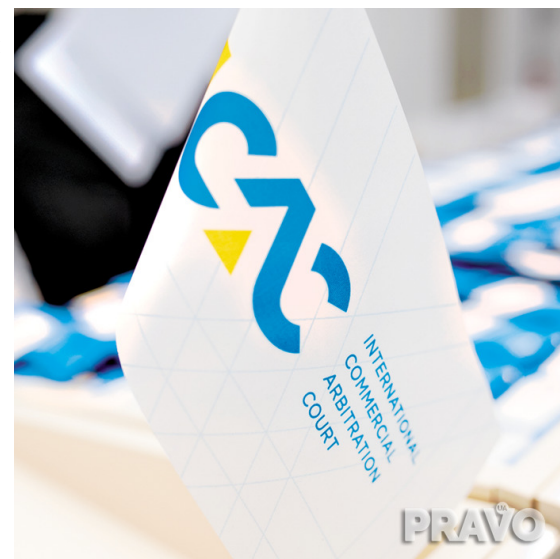
МКАС при ТПП Украины намерен приоритетизировать рассмотрение инвестиционных споров

Среди основных изменений в МКАС при ТПП Украины в 2019 году отметим